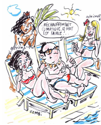
Le Président finit par croire à l'écologie à Manille

Le 26 février le président de la République François Hollande s'est rendu aux Philippines pour parler climat dans le cadre de la lutte contre le réchauffement climatique.